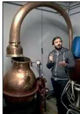
■ La distillerie des Aravis.